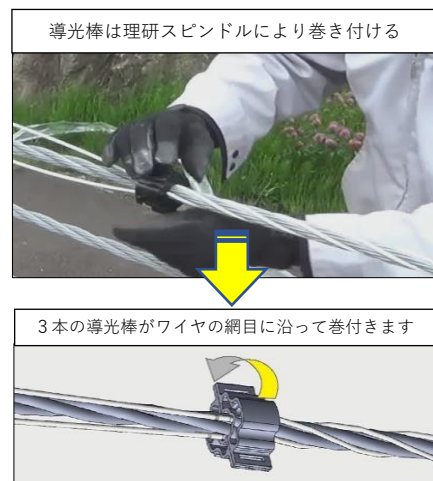
人力施工による取付け