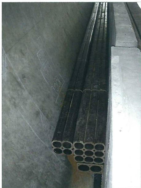
54φ 4孔・9孔 75φ 2孔