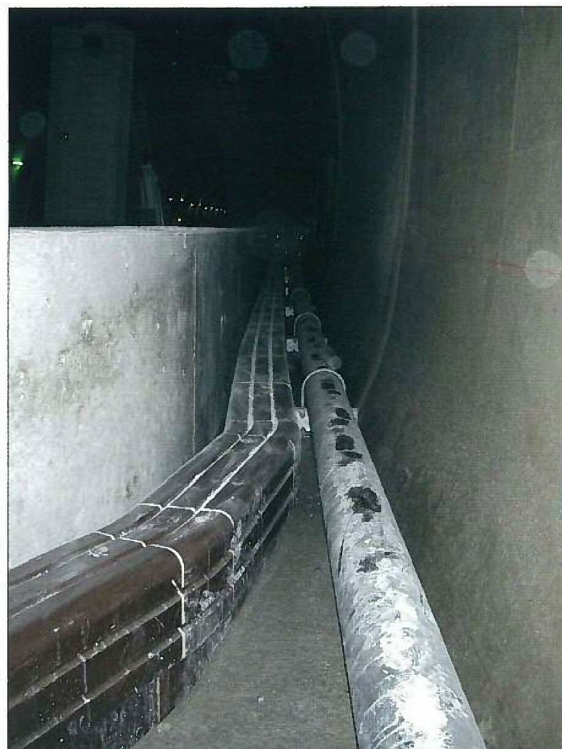
非常駐車帯部曲線管路